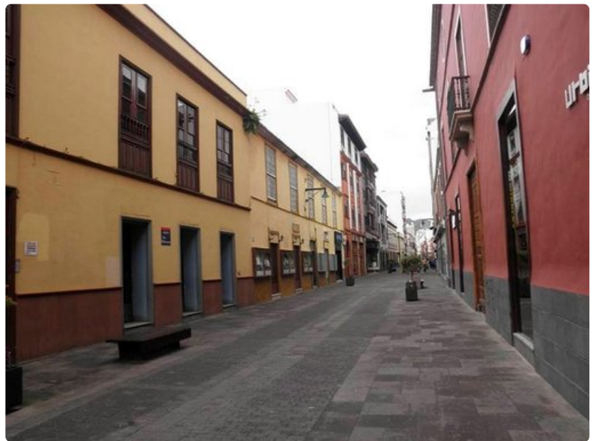
La Lagunan katukuva on miltei tyhjiillään sunnuntai-iltapäivänä