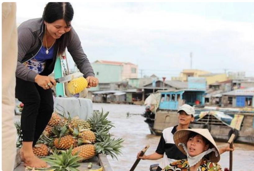
Kelluvat markkinat on tärkeä hedelmien ja vihannesten kauppapaikka.

Väkiluku: 67,5 milj. Pinta-ala: 513 120 km 2 Meren rantaa: 3219 km