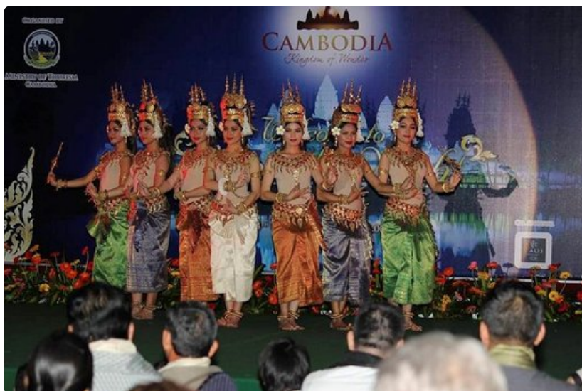
Kambodzan naisten tanssit ovat näyttäviä ja värikkäitä.