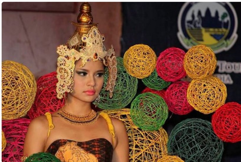
Itämaisten naisten kauneus korostuu kambodzalaisissa.