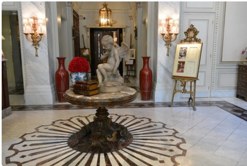
Hotel Sacherin aulan sisustus huokuu historiaa.

5. Harvest (Karmeliterplatz 1). Edullista kasvisruokaa lounas- ja päivällislistalla. Erityisen suosittu keitot.