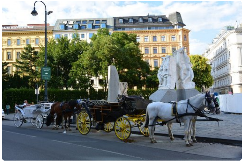
Stephansplatzin liepeiltä lähtevät hevostankurit tarjoavat leppoisaa vaihtoehtoa ydinkeskustan katseluun.