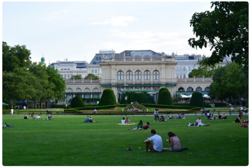
Puistoissa viihtyminen on Wienissä suosittua ajanvietettä.

Sotahistoriasta kiinnostuneille kaupungissa riittääkin nähtävää, olihan itävaltalaisyyntyinen Adolf Hitler kiinnostunut vanhan kotikaupunkinsa kehittämisestä ja suojelusta. Toisen maailmansodan aikana rakennetuista Wienin FLAK-ilmatorjuntatorneista kummatkin kaksi ovat edelleen pystyssä. G- ja L-torneiksi nimetyt teräsbetonikolossit löytyvät Augartenin puistosta (Arenbergpark). Tornien alta löytyvät niin ikään sodan varalle suunnitellut suuret pommisuojat.