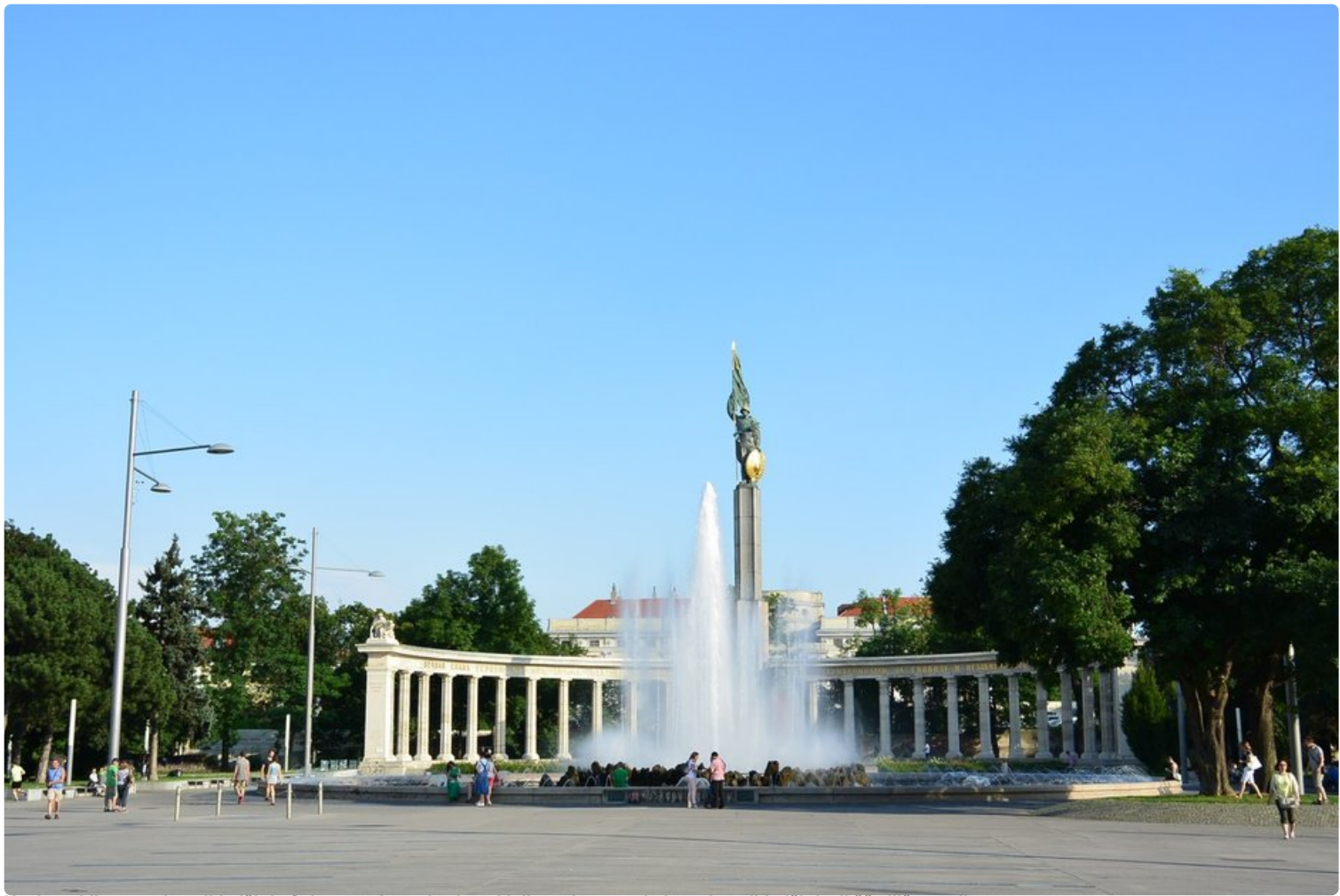
Hochstrahlbrunnenin suihkulähde Schwarzenbergplatzin aukiolla on kaupungin komein suihkulähde. Ikää sillä on reilut sata vuotta.