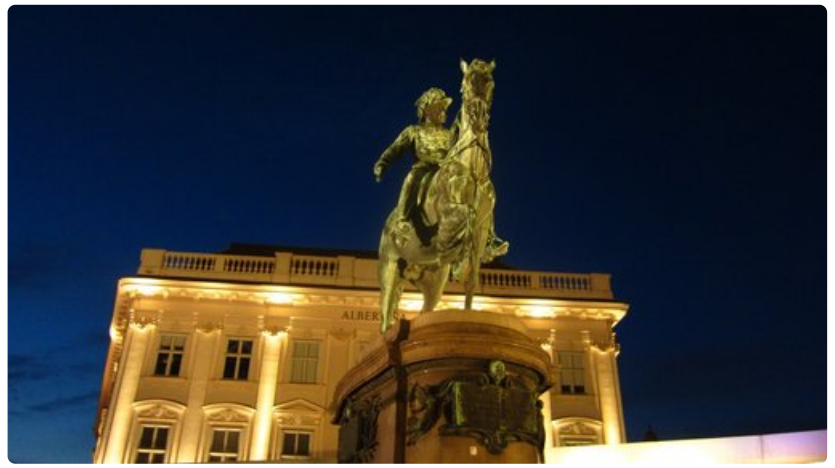
Itävallan arkkiherttua Albertin ratsastajapatsas tervehtii jylhästi Albertina-museon vieraita.

Wienin kaupunkikuvaan erottamattomasti kuuluva Riesenrad on nähty monissa elokuvissa, mukaan lukien James Bond -sarjaan kuuluvassa 007 vaaran vyöhykkeellä .